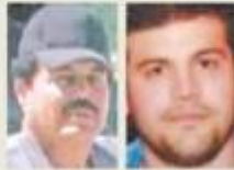
Ismael "El Mayo" Zambada. Joaquín Guzmán López.

Confirman autoridades del vecino país la aprehensión del co-fundador del Cártel de Sinaloa y del hijo de Joaquín Guzmán Loera, alias "El Chapo", otro de los co-fundadores de ese grupo delictivo; existen innumerables cargos contra los dos detenidos, advierten.